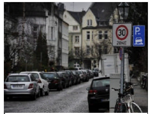
Neues blaues Parkschild in Oberkassel, das bislang illegales Parken auf Bürgersteigen legalisiert