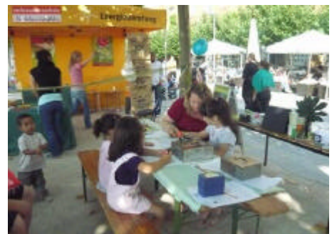
Drei der auf dem VCD-Stand gemalten Kinderbilder